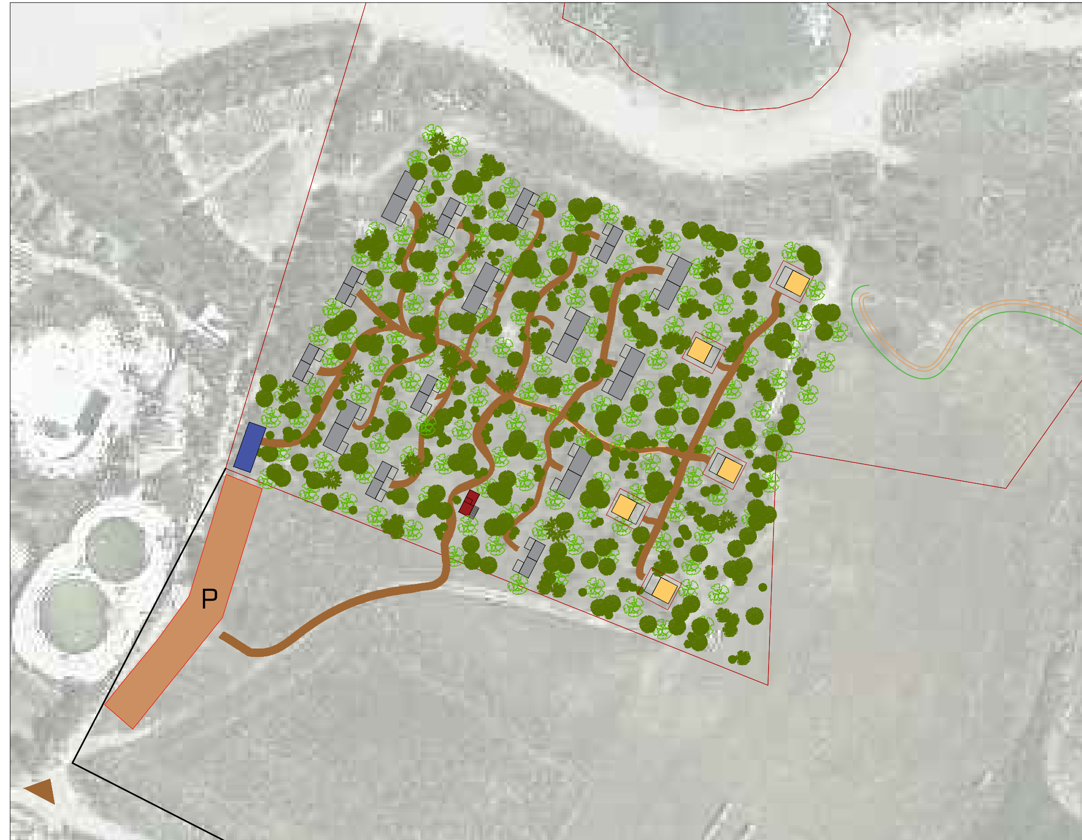
LOCALIZZAZIONE AREA D'INTERVENTO

Il presente elaborato, nonché il progetto in esso contenuto, è proprietà privata. Per legge è proibita la sua riproduzione se non espressamente autorizzata con consenso scritto (C.C. artt. 2578-2043-2048-2049 e C.P. artt. 622-623)