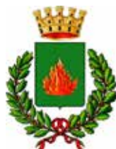
Comune di Galatone