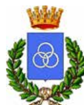
Comune di Maglie