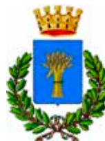
Comune di Campi Salentina