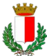
Città di Bari