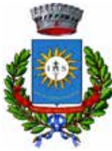
Comune di Uggiano la Chiesa