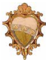
Comune di Pietramontecorvino